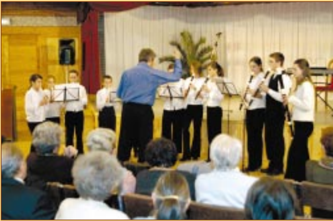
Dezső Lajos Zeneiskola növendékei