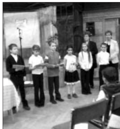
A harmadikos helyezettek