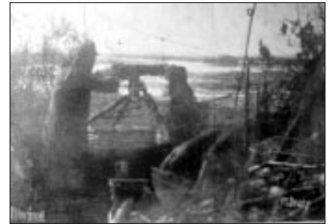
A 38./III. zászlóalj tisztikarának egy része Gépfegyverállás Piavénál