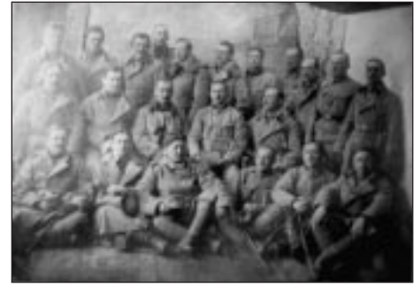
Vitéz Nagy Endre

Amikor Zalace-nél, 1916. július 2-án megsebesült, állva énekelni kezdett. „Ellőtték a jobb lábamat, folyik a piros vérem...” Kapott egy golyót a bal lábába is... de a nótát nem hagyta abba, sőt újra kezdte. „Ellőtték mind a két lábamat...”