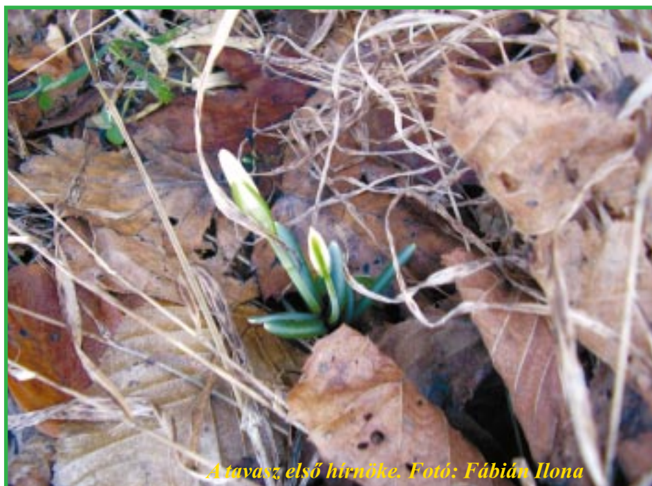
A tavasz első hírnöke.