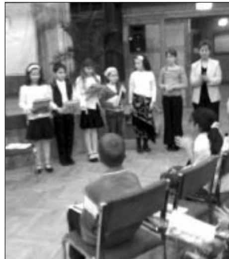
A negyedikesek eredményhirdetése