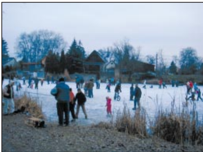
Korcsolyások a Kis-Dunán