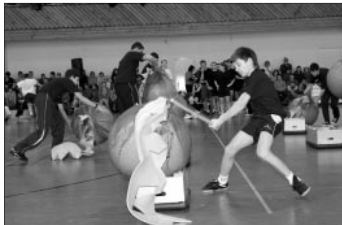
A hétfejű sárkány lefejezése

Ezúton szeretnénk megköszönni a GYEREKOLIMPIA megszervezésében résztvevő alsó- és felső tagozatos pedagógusok fáradhatatlan munkáját! Nem utolsósorban köszönet minden kis- és nagydiáknak, akik lelkiismeretesen végigcsinálták a rájuk bízott feladatokat! Színonvalas, szervezett sportrendezvénynek lehettünk tanúi!