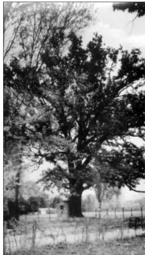
A Petőfi-fa régen