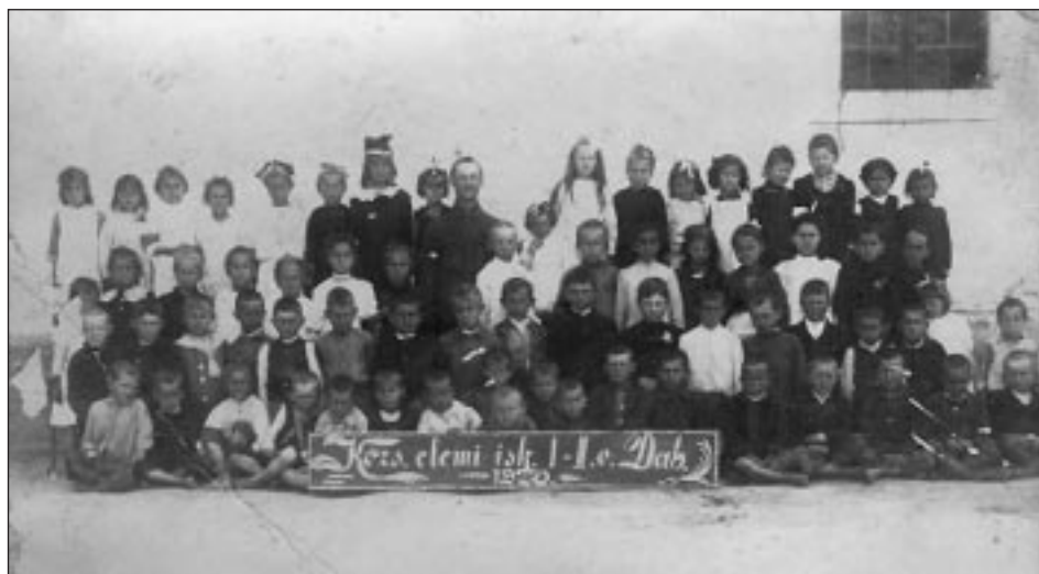
Községi elemi iskola, Dab. 1-2. osztály 1920