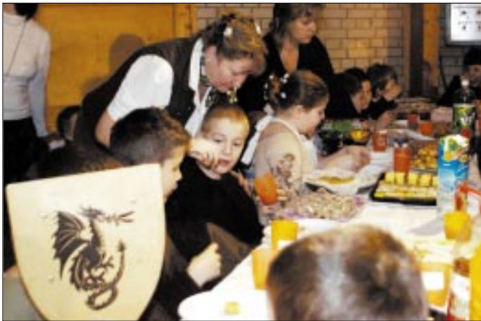
Terített asztal mellől farsangoltak a gyerekek