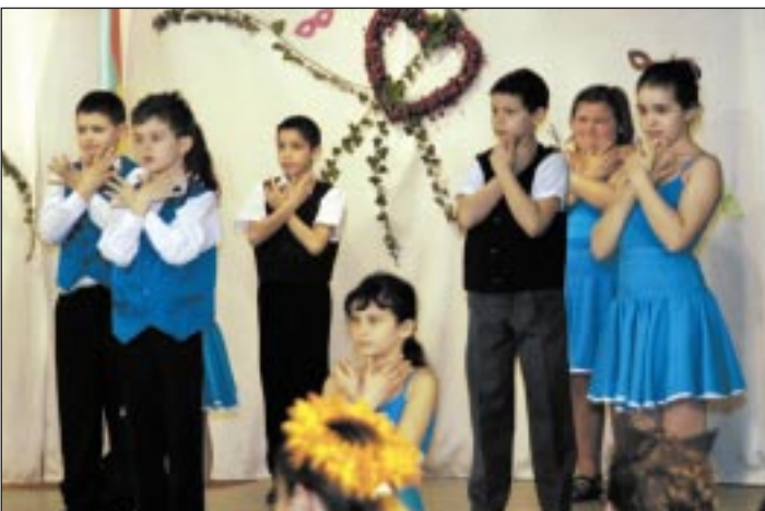
Ez a produkció mély érzelmeket tárt fel. Az Egyszer véget ér a lázas ifjúság... című zeneszámot jelbeszéddel adta elő a 3. c osztály