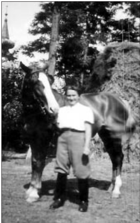
A képen szereplő személyeket nem ismerjük.