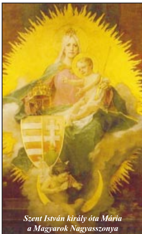
Szent István király óta Mária a Magyarok Nagyasszonya

Társadalmunk, nemzetünk alapsejtje a család. Édesanyák, édesapák, gyerekek alkotják. A tűzhely melegét évezredek óta az asszonyok, az anyák őrzik. Fontos, felelősségteljes szerep hárul rájuk. Történelmünk viharaiiban számtalanszor adták tanújelét szilárdságuknak. Gondoljunk az egri várvédő asszonyokra vagy Zrínyi Ilonára. A következő verssel köszöntjük az asszonyokat, nőket.