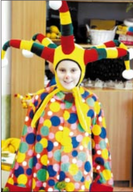
Igazi farsangi hangulatban