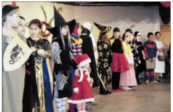
Ötletes, egyéni jelmezekben sem volt hiány