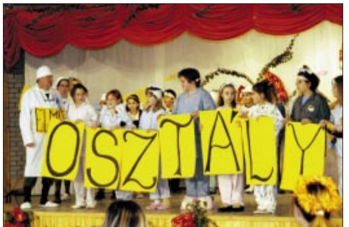
Az „elmeosztály” könnyed, mókás hangulatot teremtett a nagyteremben