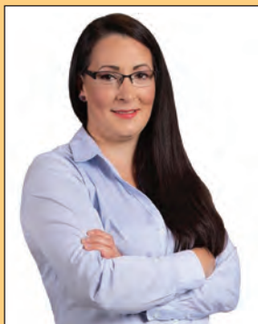
Tarr-Sipos Zsuzsa polgármester