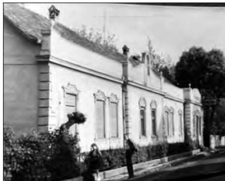
A gyógyszertár épülete

Az unokák visszaemlékezéseiből kirajzolódik, milyen volt a patika épülete, az azt kö-