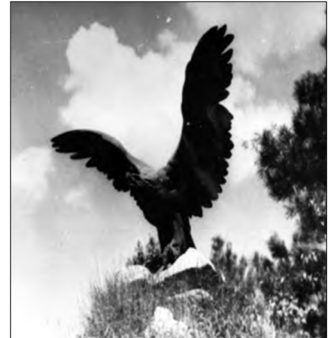
A „Sas-hegy”, tetején a turullal