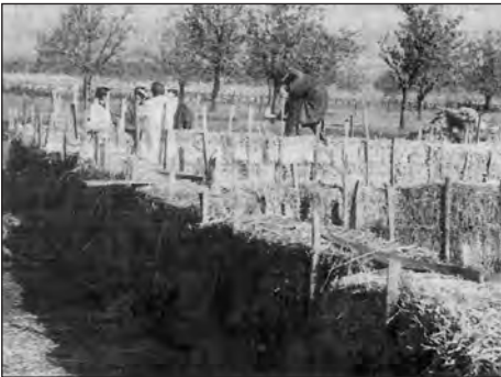
Karantént építettünk 1968-ban Kiskunlacházán

Voltak nehéz időszakok, amikor is 1962-65-ig a száj- és körömfájás tartott. Eleinte a beteg állatokat a betegség kezdeti szakaszában kiirtottuk, de ezzel a járványt nem sikerült megfogni. Ezért fálvanként karanténokat építettünk, és ott vészeltettük át a beteg állatokat.