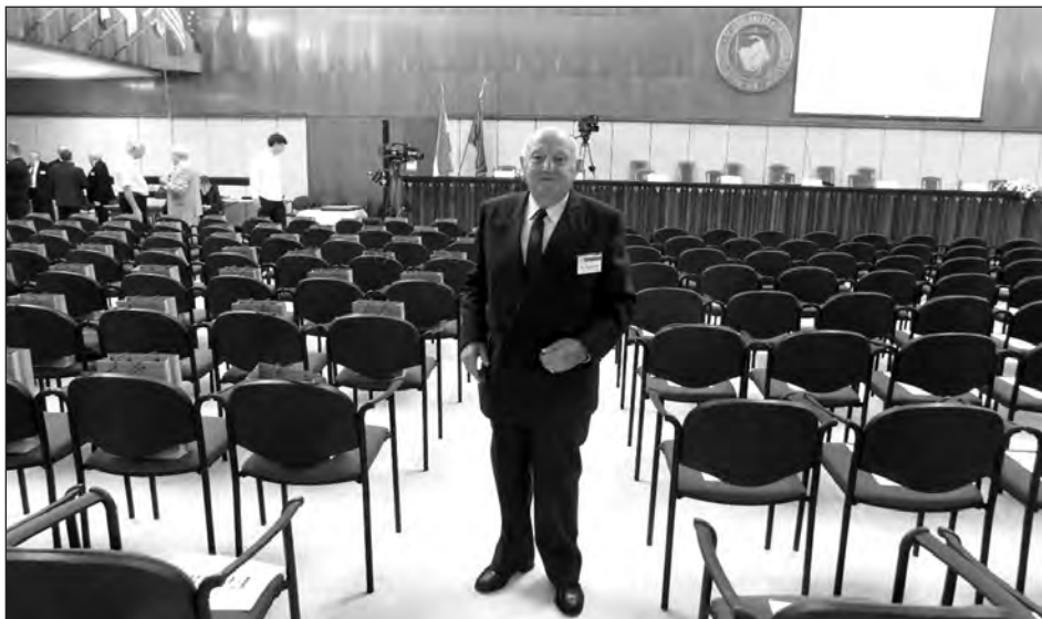
Az „Aranyoklevél” átvételén